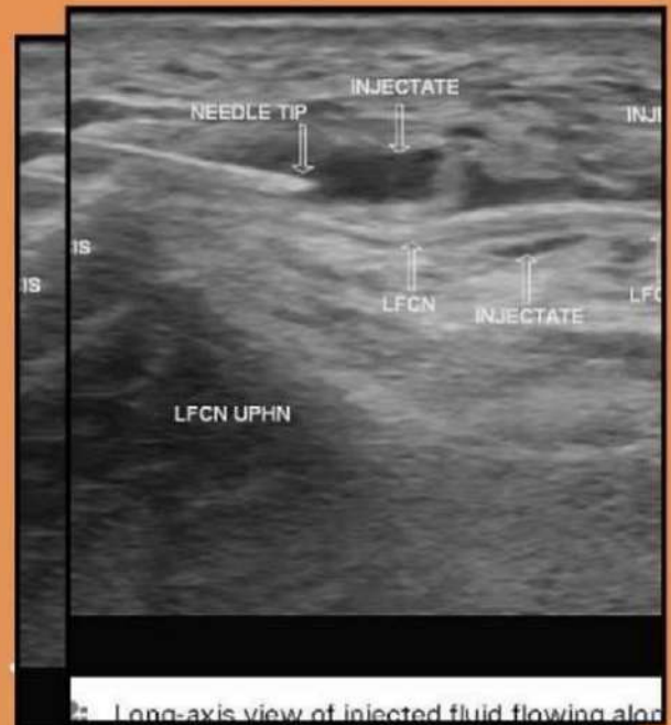
Long-axis view of injected fluid flowing along the femoral nerve